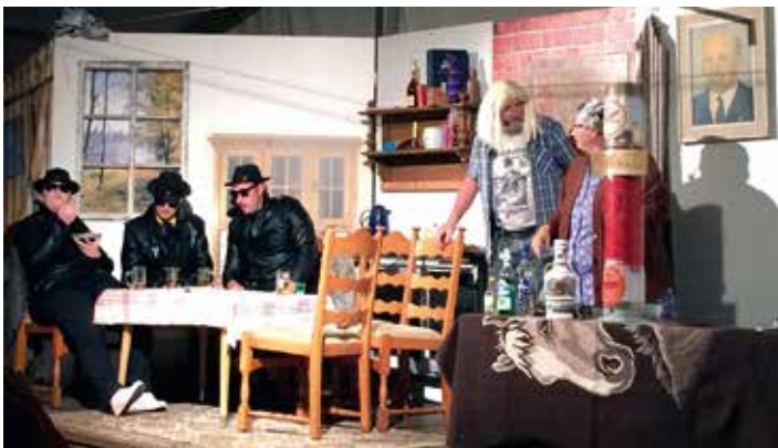
In der Kühnhaidner Schenke; Personen: Die SOKO aus Berlin, Festus und Schenk-Paula.

Nach dem erfolgreichen Auftritt mit unserem neuen Theaterstück „Hilfe, dr Westbesuch kimmt“, möchten wir es nicht versäumen, uns bei den vielen Zuschauern, welche den Weg ins Festzelt nach Kühnhaide gefunden hatten, recht herzlich zu bedanken. Ihr wart wieder ein großartiges Publikum. Die Stimmung bei beiden Vorstellungen war wieder unbeschreiblich schön. Bis bald.