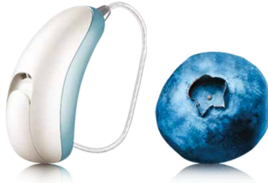
Es ist wirklich so klein!

Es ist das weltweit kleinste Hörgerät seiner Klasse und bietet modernste Technologie für maximalen Hörgenuss.