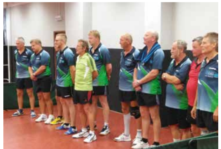
Teilnehmer TSV 1872 Pobershau e. V.

Nun schon eine schöne Tradition ist der jährlich im August stattfindende freundschaftliche Wettkampf der Tischtennisspieler des TSV 1872 Pobershau und dem TTC Litvinov aus Tschechien. Mit zwei Mannschaften, aus jeweils sechs Spielern bestehend, reisten die Pobershauer am 30.08.2019 nach Litvinov. Auch dieses Jahr erwies sich der Gastgeber wieder als stärkeres Team und siegte in beiden Wettbewerben. Natürlich wurden anschließend bei tschechischem Bier und gutem Essen die Wettkämpfe trotz sprachlicher Barrieren ausgewertet. Für Oktober ist auch ein sportlicher Vergleich auf Nachwuchsebene vereinbart worden.