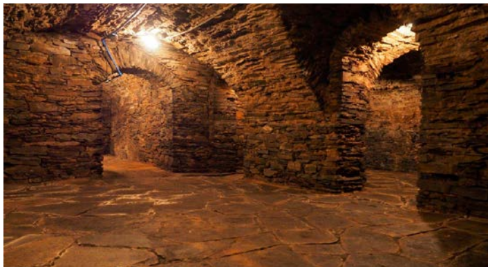
Keller in der Amtsstraße des Rathauses der Großen Kreisstadt Marienberg

Das gesamte Programm dieses Tages können Sie unter https://www.tag-des-offenen-denkmals.de einsehen. Den Tag bundesweit digital erleben, können Sie ebenfalls unter vorgenannter Adresse.