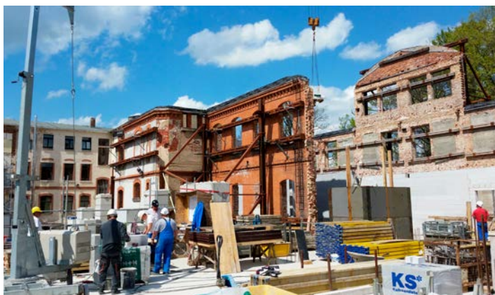
Baustelle Baldauf-Fabrik, Am Roten Turm 1 in Marienberg