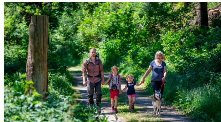
Wandern im Erzgebirge - Natur pur

Annaberg-Buchholz, 22. Juni 2022. Im Rahmen eines Wandertouren-Tests sucht der Tourismusverband Erzgebirge e.V. (TVE) auch in diesem Jahr interessierte Tourentester, die gern Wandern und dabei die Qualität der Strecken überprüfen.