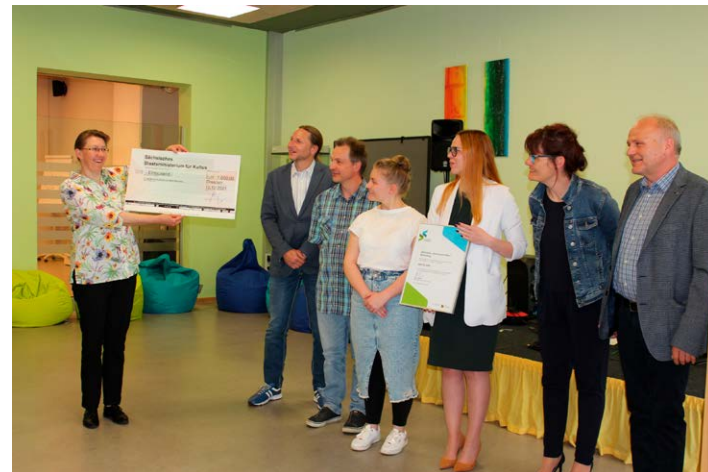
In Sachsen erhielten nur 49 Bildungseinrichtungen das Siegel. Die Oberschule „Heinrich von Trebra“ in Marienberg gehört dazu.