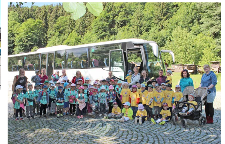
Kinder aus Niederlauterstein und Udlice ließen sich im Schwarzwassersertal von der Natur begeistern.