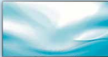
Panasonic 58 Zoll TV

TV TX-58GXF887Glossy black (146cm Diagonale) 146 cm LED-Fernseher, 58 Zoll, Auflösung: 3.840x2.160 Pixel, 4K Ultra HD, H.265 HEVC, HDR Bright Panel Plus, Quad Core Pro Prozessor, High Dynamic Range Multi-HDR-Ultimate (HDR10/PQ, HLG, HDR10+, Dolby Vision und HLG Photo), Dolby Vision, 1.800 Hz Bildwiederholungsrate, bmr Intelligent Frame Creation 4K, HCX Prozessor, DVB-T, DVB-T2, DVB-T2 HD, DVB-S2, DVB-C, TV->IP Client, HD+ integriert 6 Monate gratis (nur für Deutschland), Dynamik Surround Sound Plus, Dolby Atmos, 20 Watt maximale Gesamtleistung, Remote App kompatibel für iPhone, iPad, Android