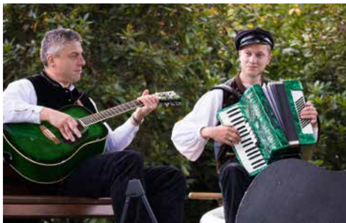
Impression der Erzgebirgischen LiederTour