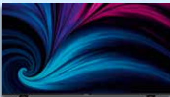
Coocea 32 Zoll TV

Aktionspreise gültig vom 26.06.2020 bis 04.07.2020