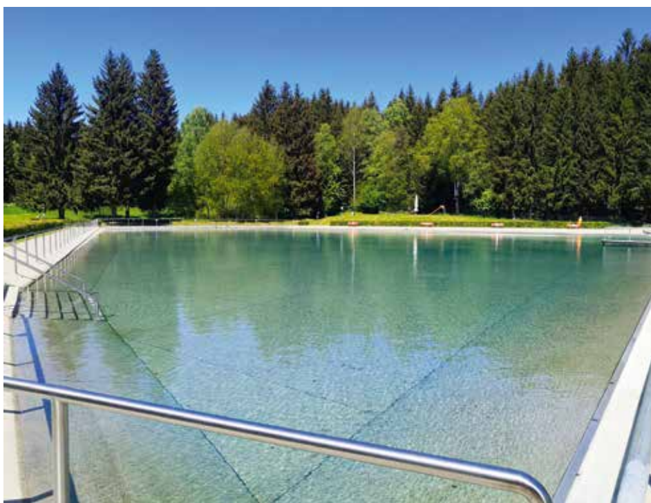
Für die neue Badesaison ist alles vorbereitet