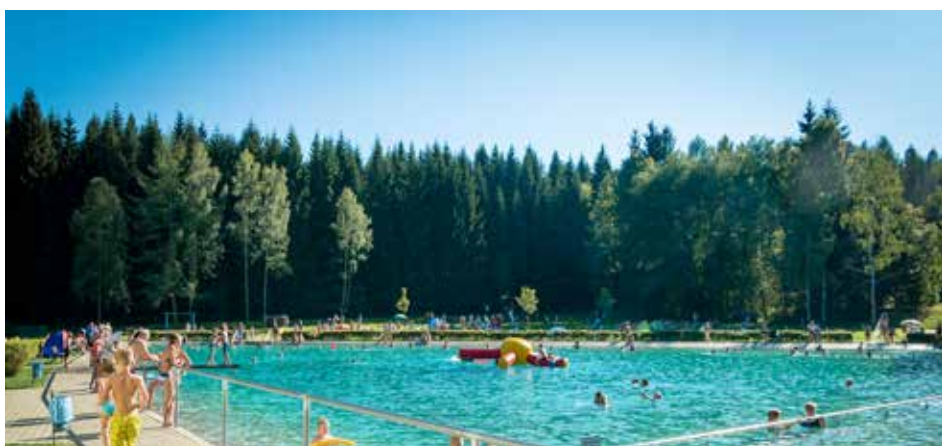
Buntes Treiben am Rätzteich im letzten Jahr