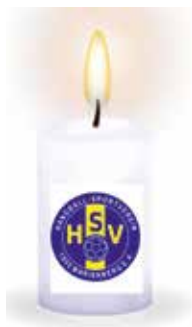
Licht für Zuversicht